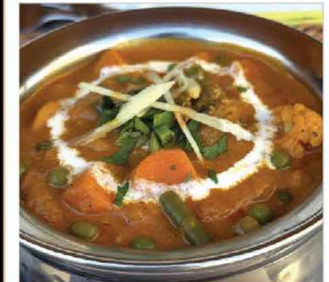
Veg Curry (ベジタブルカレー) Mixed seasonal vegetables simmered in a milky spiced curry sauce 彩り豊かな野菜をスパイスで煮込んだカレー