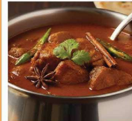
Pork Curry (ポークカレー) Tender pork simmered in a rich, aromatic spice sauce 香り高いスパイスで煮込んだポークカレー