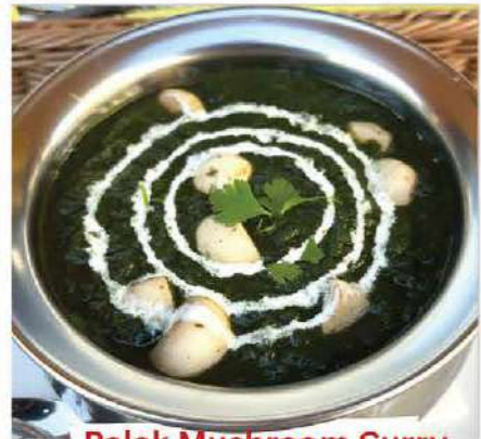
Palak Mushroom Curry (パラク・マッシュルームカレー) Yellow lentils tempered with aromatic spices 香ばしいスパイスで仕上げたインド豆のカレー