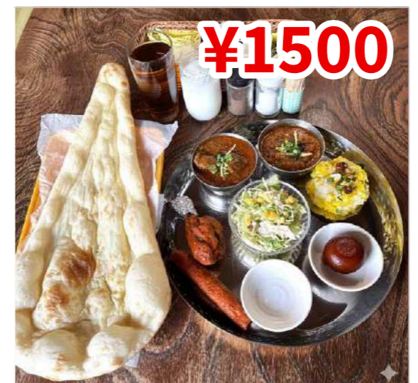
¥1500 Dランチセット (D Lunch Set) 1行目・2行目よりお選びいただけるカレー2種、シークケバブ1本、タンドリーチキン、グラブジャムン、サラダ、ナン、ライス、ソフトドリンク1杯付き