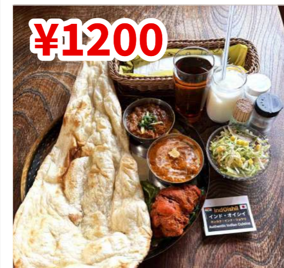
¥1200 Bランチセット (B Lunch Set) 1行目・2行目よりお選びいただけるカレー2種、チキンティッカ、サラダ、ナンまたはライス、ソフトドリンク1杯付き