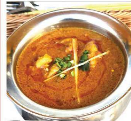
Chicken Curry (チキンカレー) Tender chicken simmered in a rich, aromatic spice sauce 香り高いスパイスで煮込んだチキンカレー