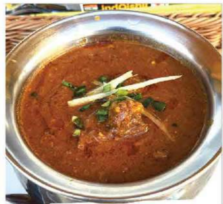
Mutton Curry (ラムカレー) クセが少なく柔らかなラム肉を、香り豊かなスパイスでじっくり煮込んだ上品なカレー