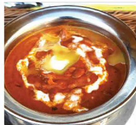
Butter Chicken (バターチキン) 柔らかな鶏肉を、香り高いスパイスと濃厚でなめらかなトマトバターソースで仕上げた上品なカレー