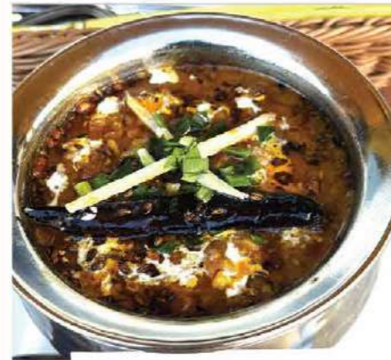
Daal Tadka (ダール・タルカ) Yellow lentils tempered with aromatic spices 香ばしいスパイスで仕上げたインド豆のカレー