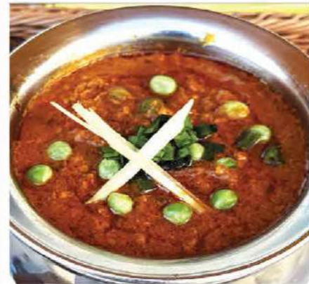
Keema Matar (キーマ・マタール) Minced meat with green peas and aromatic spices スパイス香るひき肉とグリーンピースのカレー