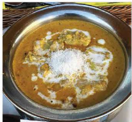
Seafood Curry (シーフードカレー) 新鮮な魚介を香り豊かなスパイスとココナッツベースで仕上げた、軽やかで旨みのあるカレー