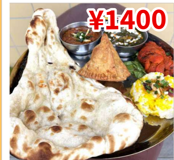
¥1400 Cランチセット (C Lunch Set) 1行目・2行目よりお選びいただけるカレー2種、チキンティッカ、サモサ、サラダ、ナン、ライス、ソフトドリンク1杯付き