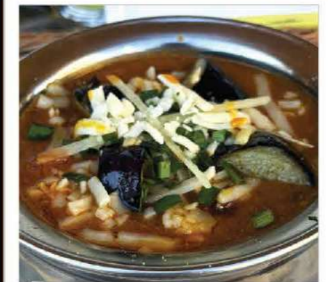
Keema Nasu Cheese Curry / キーマナスチーズカレー 芳醇なスパイス香るキーマに、ナスの甘みとコクのあるチーズを合わせ、じっくり仕上げた贅沢な一皿