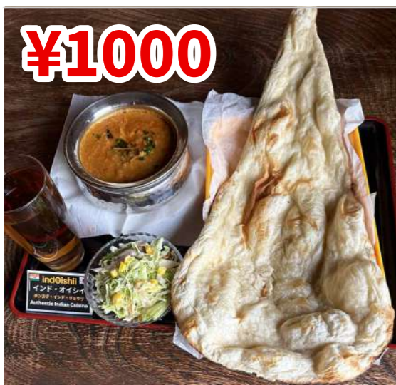
¥1000 Aランチセット (A Lunch Set) 1行目よりお選びいただけるカレー、ナンまたはライス、サラダ、ソフトドリンク1杯付き