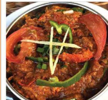
Spicy Chicken (スパイシーチキン) ジューシーな鶏肉を、香り高いスパイスで仕上げた、コク深く刺激的なチキンカレー